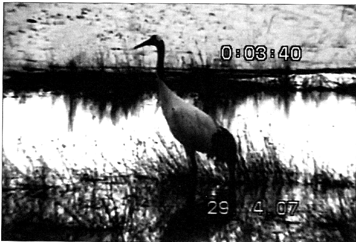
Илл. 1. Японский журавль Grus japonensis на берегу залива Анива, о. Сахалин. 29 апреля 2007 г.

29 апреля 2007 г. житель п. Таранай П.Г. Бахарев наблюдал и сфотографировал японского журавля на берегу залива Анива, в 1,5 км южнее поселка (илл. 1, 2). Птица кормилась на песчаном пляже морского берега, присыпанном свежевывавшим снегом.