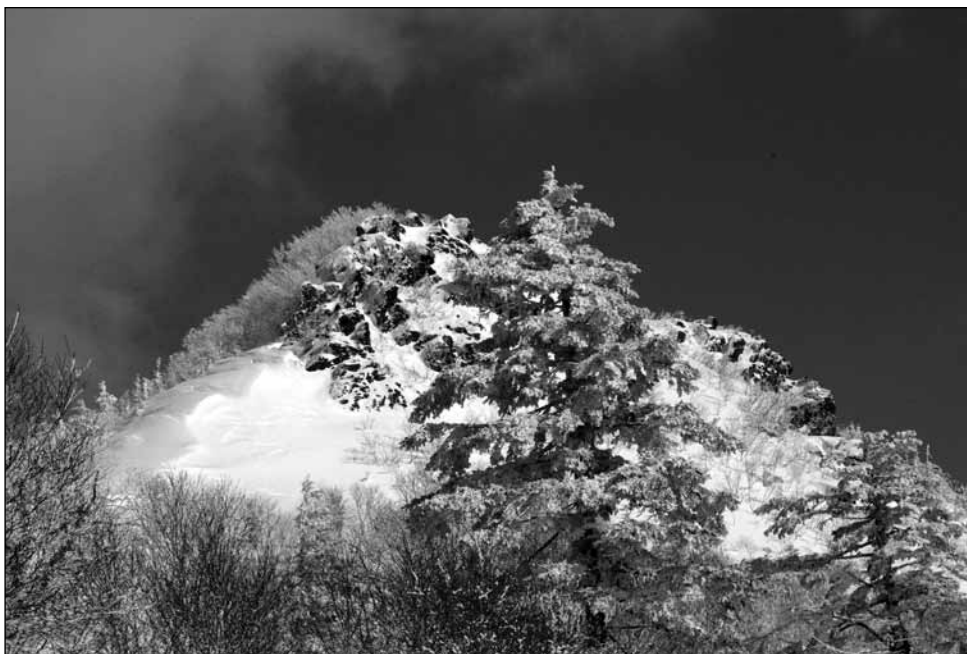
Ил. 2. Настоящая гора Российская

Приведенные выше примеры грубых географических ошибок относятся к числу наиболее часто употребляемых и трудно изживаемых штампов. Они кочуют по страницам книг и журналов, и порой кажется, что никакая сила не способна справиться с ними.