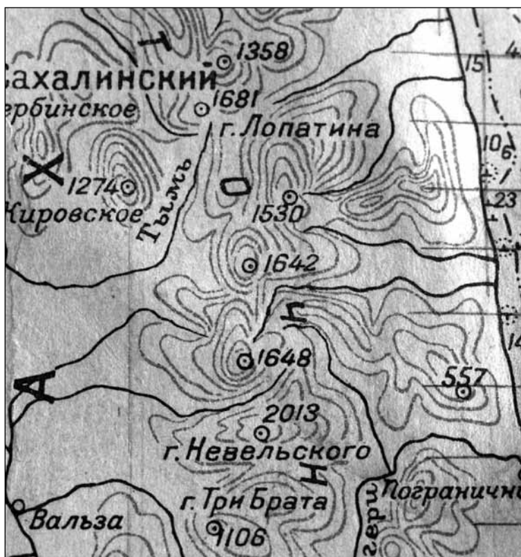
Ил. 3. Фрагмент морской карты акваторий о. Сахалин, 1958 год. На ней высота горы Невельского ошибочно указана как 2013 м, а гора Лопатина – 1681 м