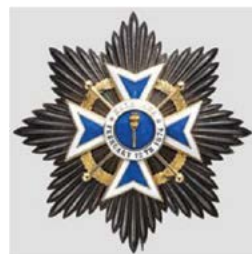
Гавайский орден Большого Креста. 1883 г.

августа 1888 г. вновь назначен командиром броненосного корабля «Екатерина-II». С 1 по 26 мая 1889 г. на том же корабле, и с 27 и 30 июня 1889 г. на лодке