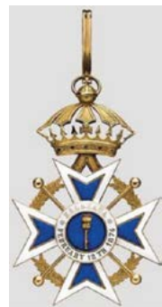
Орден гавайской короны Калакауа. Гавайский орден 1885 г.

Высочайшим приказом по флоту за № 262 от 16 сентября 1885 г. за отличную службу присвоено звание капитана I ранга 32 . 22 сентября 1885 г. награжден Орденом Святого Владимира 4 степени с бантом за совершение 20-месячной